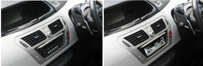
シトロエン C4 Picasso 取付後例