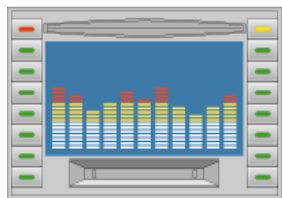
市販カーAV/カーナビ (赤外線リモコン機能付)