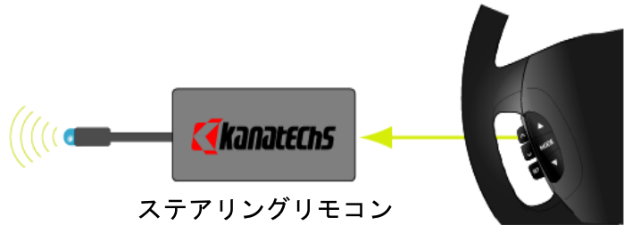
ステアリングリモコン インターフェイス